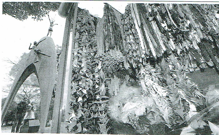
原爆の子の像(左)に供えられた折り鶴(広島市中区の平和記念公園で)