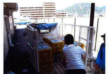
プレスしたアルミ缶をボックスに入れて納品する

新聞紙はクッション材料に、キャップはエコキャップ推進協会に寄贈します。地域単位などの回収方法のご相談に応じますので、お気軽に御連絡下さい。第2森の工房 AMA Tel.888-8820 担当 中原・陶山(障害福祉サービス事業所 森の工房やの内)