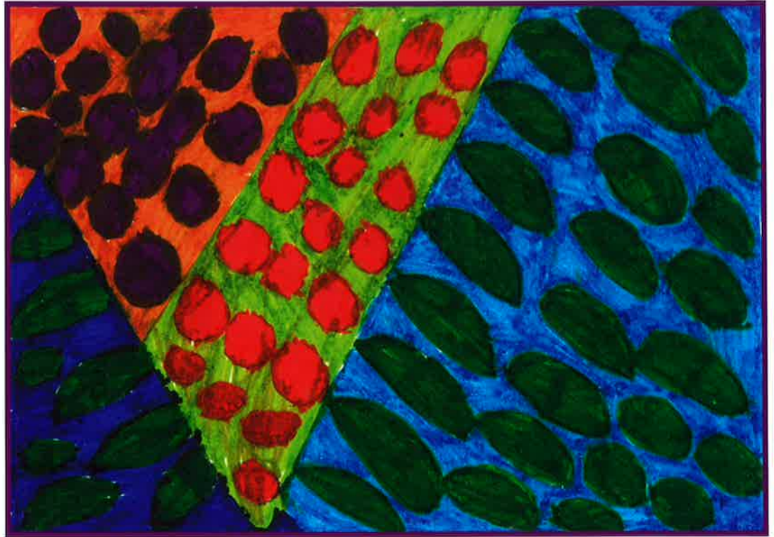
「楽しかった思い出」マジック使用 作画 森の工房みみずく・生活介護 金子 友美