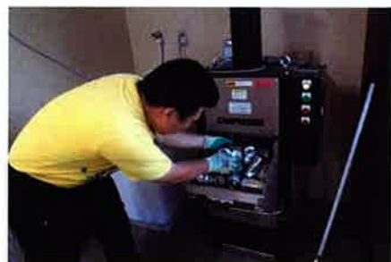
小型のプレス機の中にアルミ缶を入れる