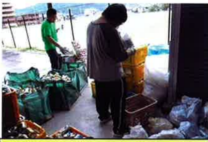
回収したアルミ缶を袋から取り出し選別